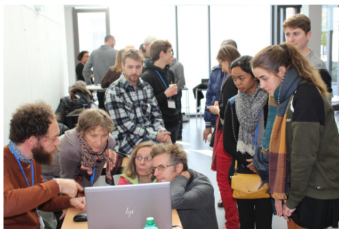
Atelier cartographique spontané à SAGEO'2019, 13-15 novembre 2019 à Clermont-Ferrand